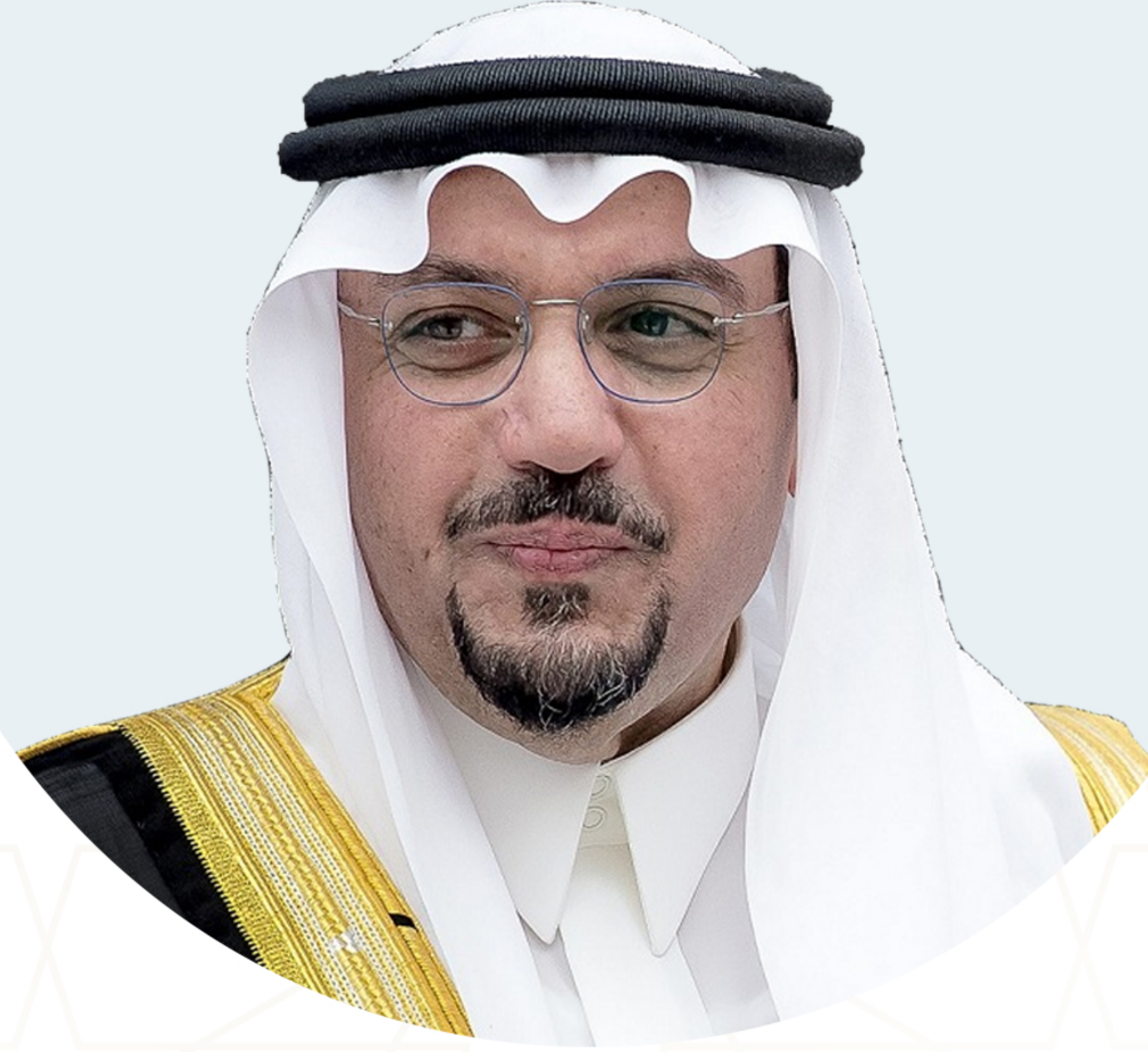
صاحب السمو الملكي الأمير الدكتور فيصل بن مشعل بن سعود بن عبدالعزيز حفظه الله ورعاه - أمير منطقة القصيم

إن العمل الخيري في بلادنا هو عمل تطوعي وخيري ابتغاء الأجر، وهذا هو ديدن أبناء هذا الوطن، ويدل على أن المجتمع خيري غرست فيه هذه الفطرة ابتغاءً للأجر والمثوبة من عند الله عز وجل